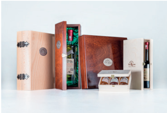
Geschenksboxen: Preise nach individueller Zusammenstellung